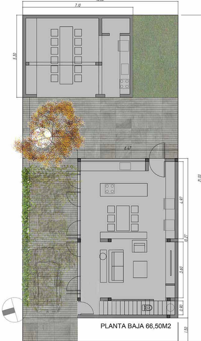
PLANTA BAJA 66,50M2